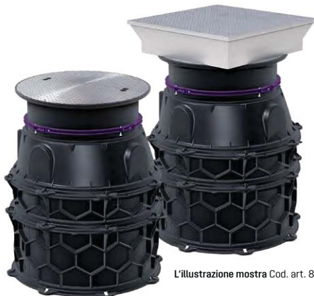
L'illustrazione mostra Cod. art. 874 01 43