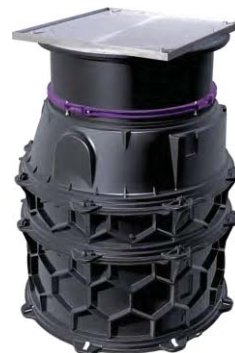
L'illustrazione mostra Cod. art. 874 00 20